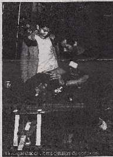
Un vigilante de los detalles de la noche.