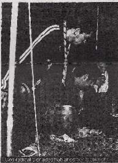
Los radicales de la noche hablaban con los ovnis.